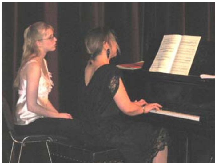
Konsert på Nordiska Musikgymnasiet

Den lokala arbetsplanen är på Nordiska Musikgymnasiet ett av de viktigaste redskapen för ett strukturerat utvecklingsarbete. Arbetsplanen finns tillgänglig i en gemensam mentorsmapp i skolans datasystem och den uppdateras kontinuerligt allteftersom det tillkommer nya avsnitt efter diskussioner inom den pedagogiska gruppen.