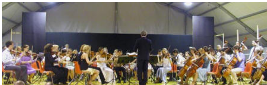
SUSOs turné till Italien

Konsert på Nordiska Musikgymnasiet Samarbetet med Stockholms Ungdomssymfoniorkester och Kulturskolan i Stockholm fortsatte även under 2005. Under sommaren 2005 genomfördes även en turné till Italien.